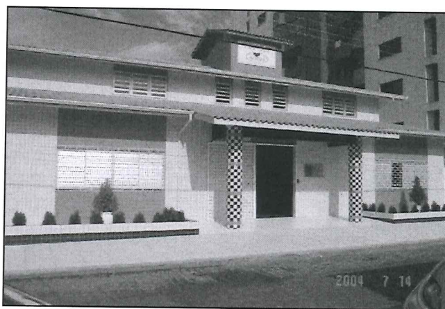
CENTRO DE EDUCAÇÃO INFANTIL SANTA TEREZA - APROET