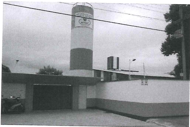
CENTRO DE EDUCAÇÃO INFANTIL SANTO AFONSO - APROET