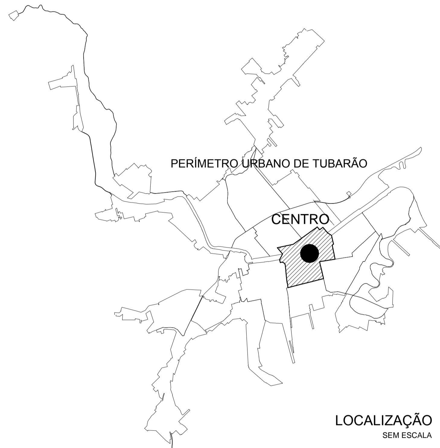
LOCALIZAÇÃO SEM ESCALA